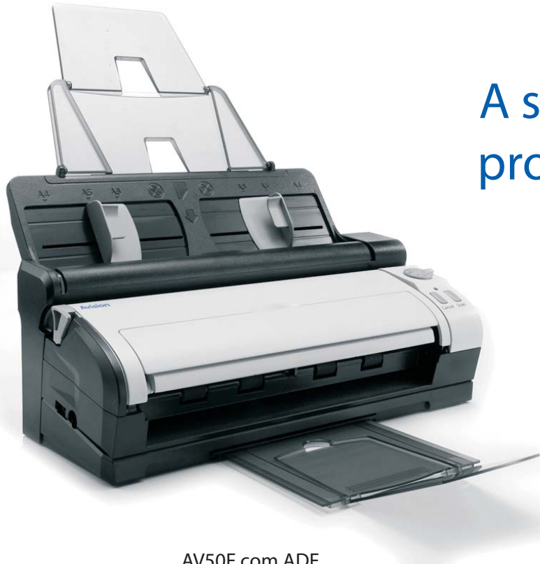
AV50F com ADF