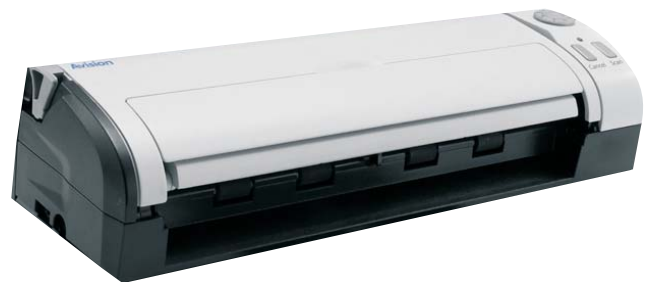
AV50F módulo destacável