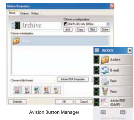
Avision Button Manager

O scanner Avision AV50F vem com os drivers TWAIN e ISIS e também é fornecido com o scanner a versão completa do software exclusivo Avision Button Manager, ScanSoft PaperPort, Avision ScanProfolio, WorldCard.