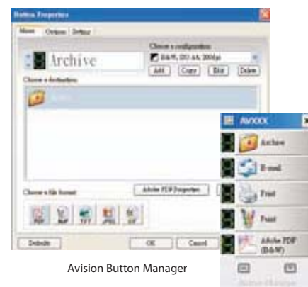
Avison Button Manager

O scanner Avison AVA6+ vem com os drivers TWAIN e também é fornecido com o scanner o software exclusivo Avison Button Manager, ScanSoft PaperPort.