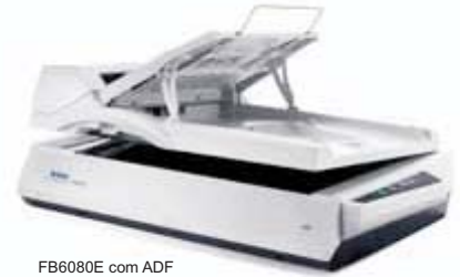
FB6080E com ADF

PaperPort é a maneira mais fácil de transformar pilhas de papel e fotos em arquivos organizados que você pode encontrar rapidamente, usar e compartilhar. Pare de perder tempo à procura de documentos. Fim da frustração de organizar, editar e partilhar as suas fotografias digitais. PaperPort torna mais simples para conectar o scanner e computador. Ele é a solução perfeita para sua casa ou pequeno escritório.